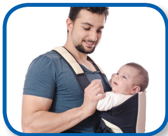
Ven conmigo De 3 a 6 meses