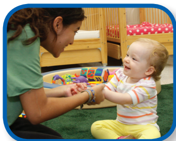
Te quiero De 6 a 12 meses