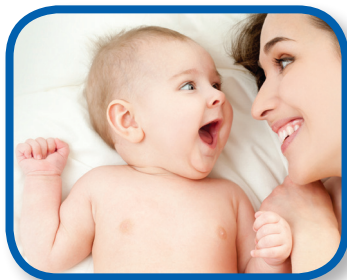
Sonríe De 0 a 3 meses