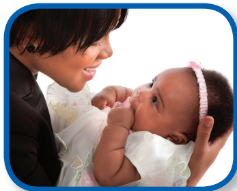
¡Cante! De 3 a 12 meses